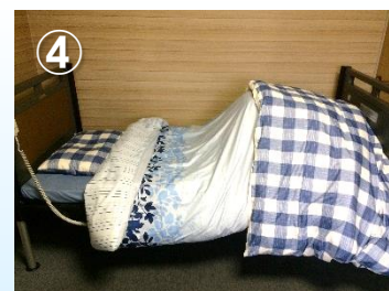
④シングル掛布団を掛けます。