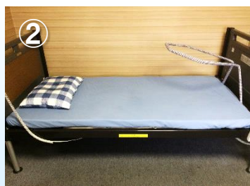
②本体を設置します。