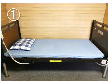
①ベッド上の掛布団を下します。