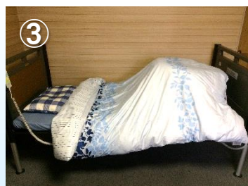
③セミダブル掛布団を掛けます。